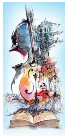
Der Kulturfonds Bayern

„Gerade in dieser schwierigen Corona-Zeit sind belastbare, planungssichere Förderimpulse für unsere vielfältige, kleingestaltige Kulturszene enorm wichtig! 302.300 Euro für Kulturprojekte in Augsburg sind ein wichtiger Baustein für das kulturelle Leben und damit die Lebensqualität in unserer Stadt. Ich freue mich sehr über die Förderung aus dem Kulturfonds, die den Kulturschaffenden etwas finanzielle Sicherheit in dieser herausfordernden Zeit bietet“, erklärt der Augsburger